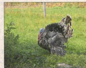
Wehrhafter Truthahn in Sauberg, zuständig für Düngung und Bewachung der Obstgärten.

Gut gediehen ist in jedem Fall das Projekt der Öko-Modellregion Waginger See - Rupertiwinkel seit der Gründung im Jahr 2014. Das Ziel war, ausgehend vom damaligen Landwirtschaftsminister Helmut Brunner, dass bis 2020 die ökologische Landwirtschaft sich verdoppeln solle. Im Gebiet der Modellregion ist das Ziel realistisch. Gab es zur Bewerbung im Jahr 2013 in den sieben Gemeinden Fridolfing, Kirchanschöring, Petting, Taching, Tittmoning, Waging und Wonneberg noch 51 Ökobetriebe (von